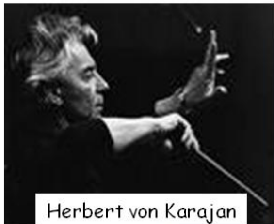
Herbert von Karajan