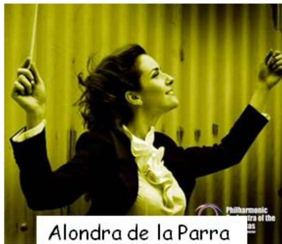
Alondra de la Parra